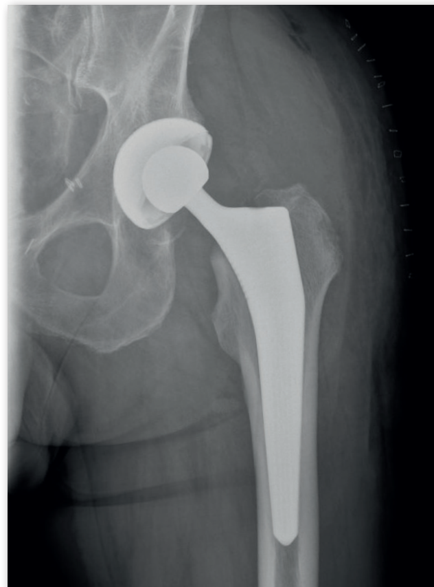
Röntgenbild nach der Operation | Hüft-TEP links

Bereiten Sie sich, den Krankenhausaufenthalt und Ihre Rückkehr nach Hause sorgfältig vor. Konsultieren Sie rechtzeitig Ihren Haus- und Zahnarzt. Wenn Sie Übergewicht haben, ist jetzt ein guter Zeitpunkt, um etwas dagegen zu tun, denn jedes Kilo Körpergewicht weniger senkt die Belastung für das neue Gelenk. Mit dem Rauchen aufzuhören ist auch insbesondere vor der Operation eine gute Idee, weil Nikotin die Wundheilung beeinträchtigen kann. Erstellen Sie eine aktuelle Liste der Medikamente, die Sie einnehmen sowie Ihrer Allergien und Vorerkrankungen / Voroperationen. Vor der Operation dürfen Sie ab Mitternacht des Vortages nichts mehr essen und trinken. Manche Medikamente (z.B. gewisse Blutverdünner, Metforminhaltige Antidiabetika) dürfen am OP-Tag nicht eingenommen werden und müssen daher rechtzeitig „abgesetzt“ werden. Eine Hüft-TEP kann in Vollnarkose oder Spinalanästhesie eingesetzt werden. Der Narkosearzt wird Sie in der Wahl des geeigneten Verfahrens beraten.